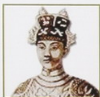
Su Majestad Imperial Minh-Mang, tatarabuelo de Su Alteza Imperial Princesa Thi-Nga de Vietnam

Vestido adornado con topacios azules y amatistas (para un total de 200 quilates) de Imperial Couture-Gala Collection , bufanda en satén adornada con topacios (50 quilates) de Imperial Couture-Summer Resort Collection con broche y aretes de diamantes de Imperial Collection-Jewelry , diseñados por la princesa. Calzado de Manolo Blahnik/New York