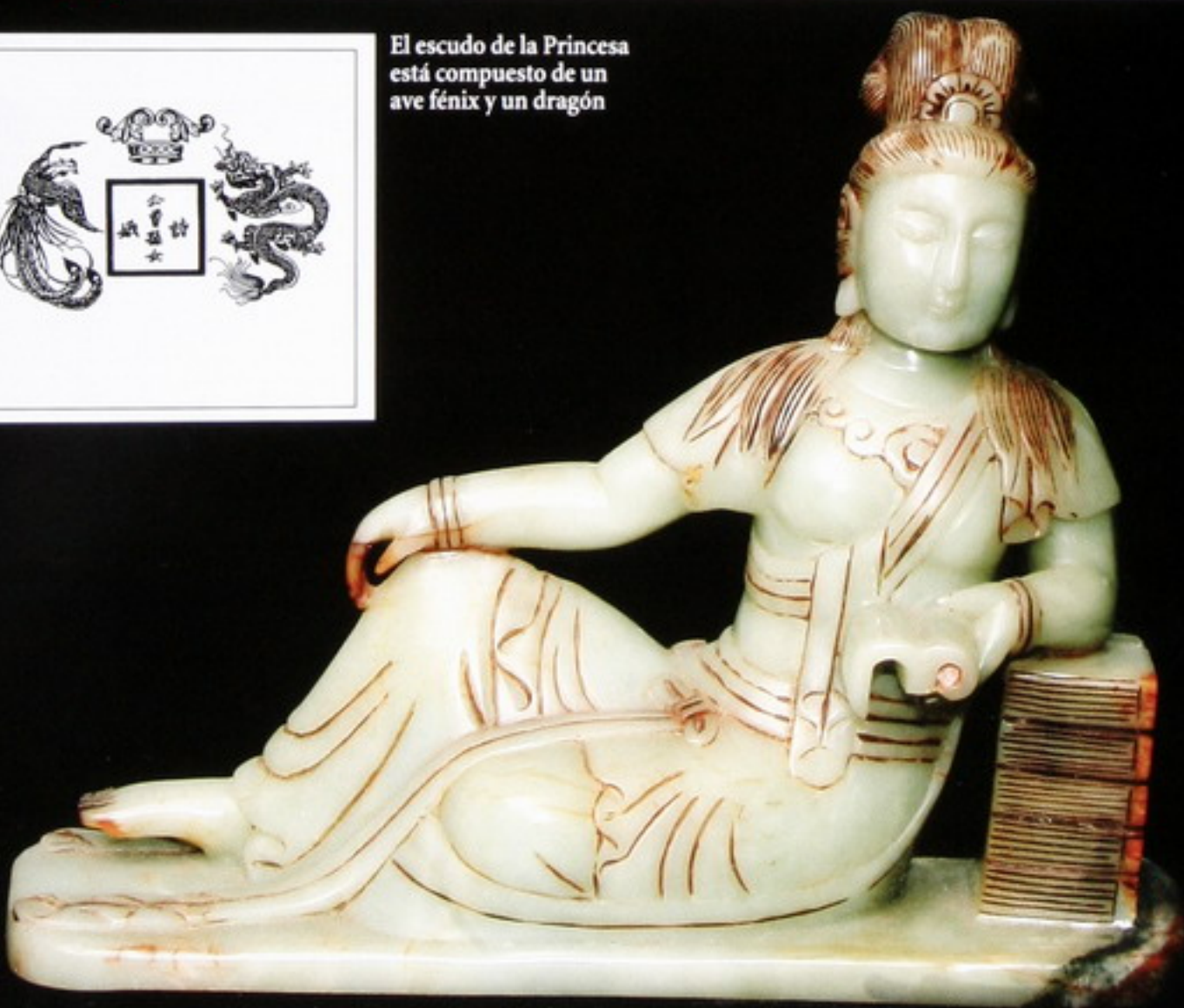
Durante la época imperial, el jade era considerado la piedra más preciosa de todas