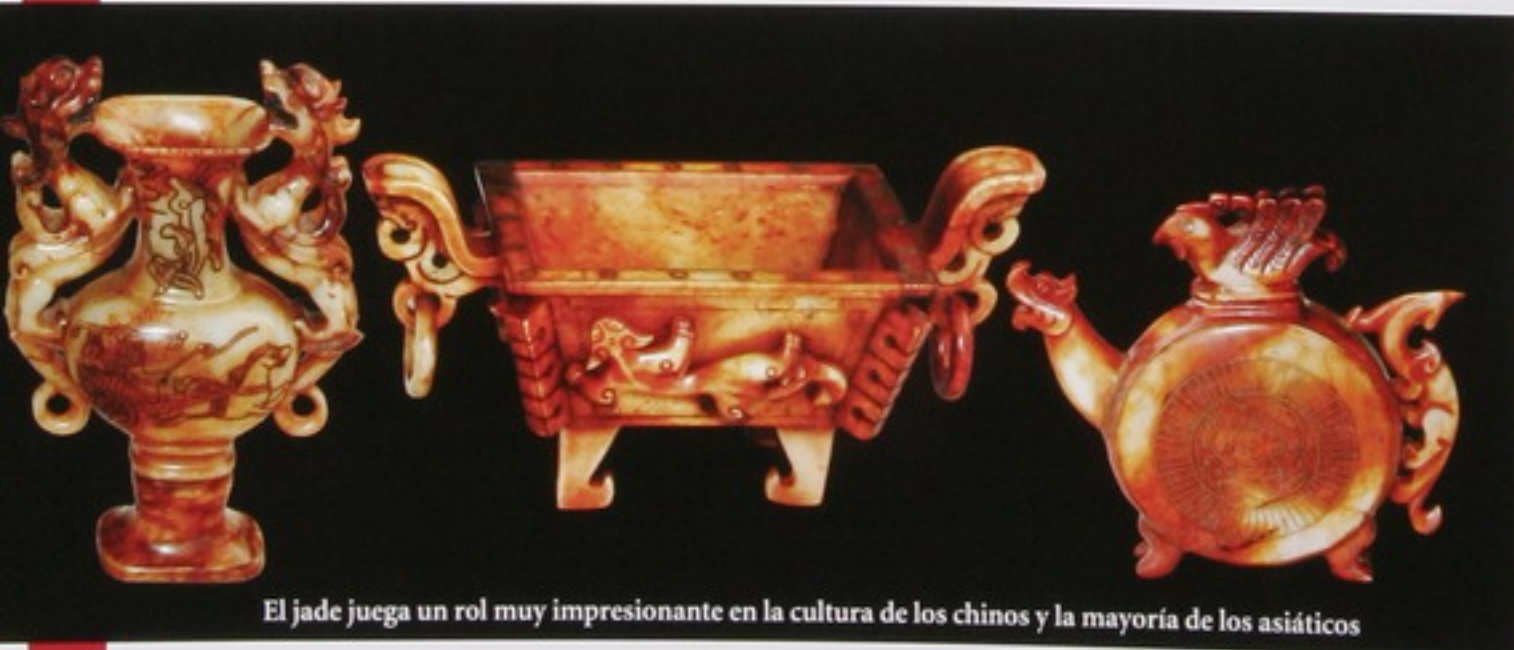
El jade juega un rol muy impresionante en la cultura de los chinos y la mayoría de los asiáticos

"Creo que se está convirtiendo en una gran ciudad. Ya tenemos compañías de ballet, opera, grandes galerías de arte, y aquí convergen personas de todas partes del mundo. Ahora vivo aquí, y he sido muy bien recibida. Me siento muy bien, sobretodo con mis amigos cubanos. Opino que como ustedes han sufrido la tragedia y el dolor de ver a su patria caer bajo el comunismo, compartimos un destino parecido. Y esto los hace a ustedes más abiertos a aceptar otras culturas y razas". Y continúa diciendo: "Lo peor del comunismo no es sólo la pérdida de la patria y de la libertad, sino también que destruye el espíritu... el alma del ser humano. Vivir con ese miedo es terrible... es peor que la muerte". Y nos confiesa: "Esta exhibición se la he dedicado a Su Majestad Imperial Gia Long, quien también fundara la bella ciudad de Hue, hoy monumento histórico mundial". ▶