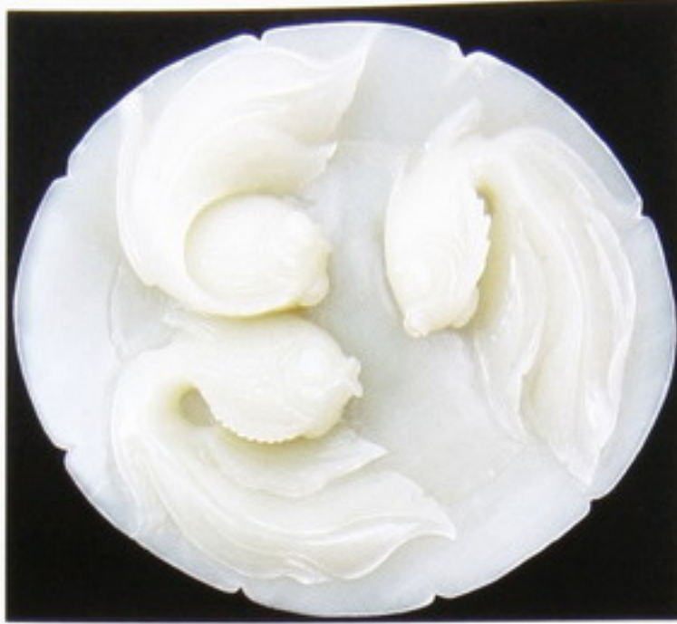
En la antigua China el jade reflejaba cualidades como la nobleza, perfección, constancia, inmortalidad, pureza e integridad