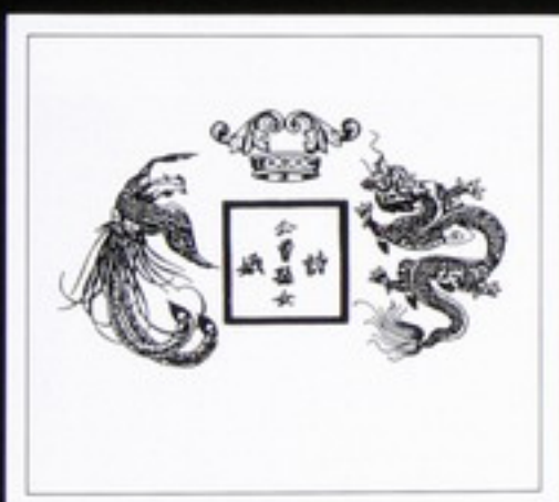
El escudo de la Princesa está compuesto de un ave fénix y un dragón

"Casi siempre visto así. Hoy no sabía si decidirme por un Valentino o un Oscar de la Renta. Pero pensé que era adecuado llevar un diseño que uniera a Oriente y Occidente. Claro, en los eventos a los que asisto, siempre trato de vestir más a lo Oriental. No sé si sabe que el traje nacional viet- ▶